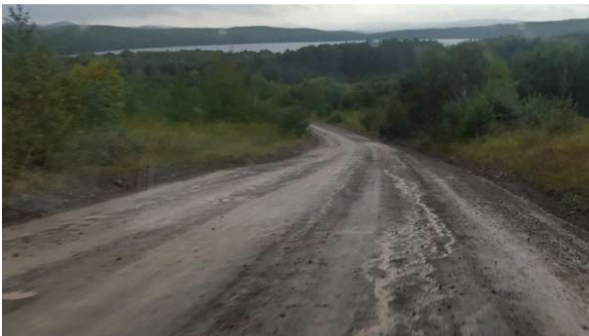
спуск на гравийной дороге от д. Кайчак – пос. Инголь