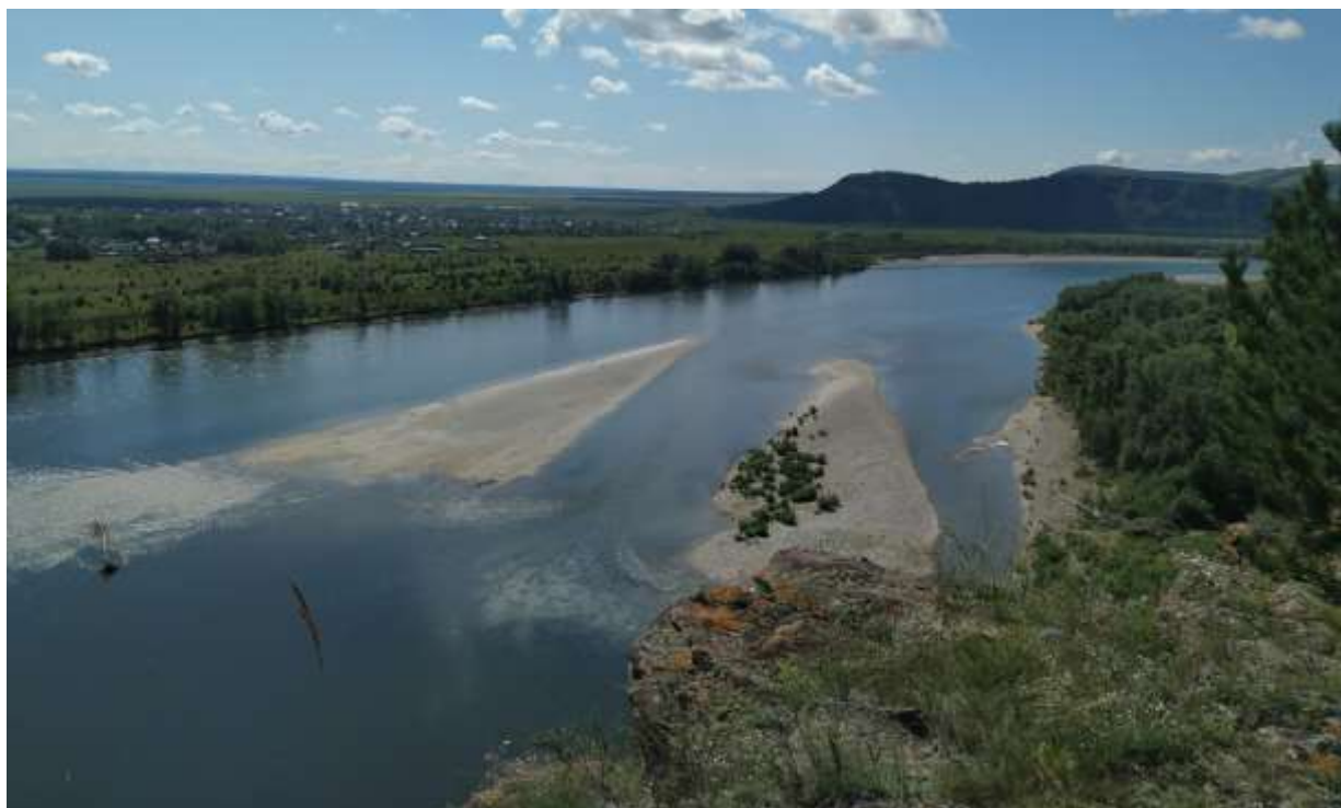
вид с горы на реку Тесь и одноименный поселок

чаепитие с «походным» тортом и душевные разговоры у костра. Наутро попрощались с друзьями и двинулись дальше.