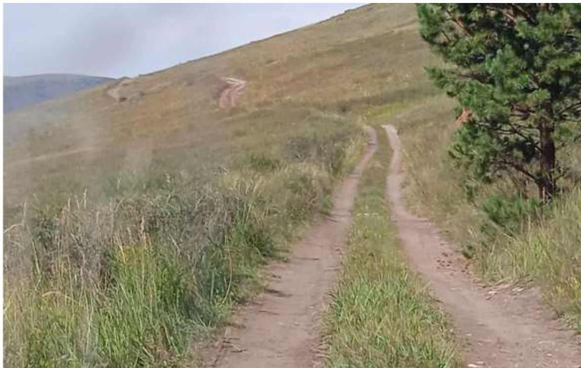
траверс уклон 6-7°

полном приводе на пониженной передаче. Общий перепад высоты примерно 300 метров.