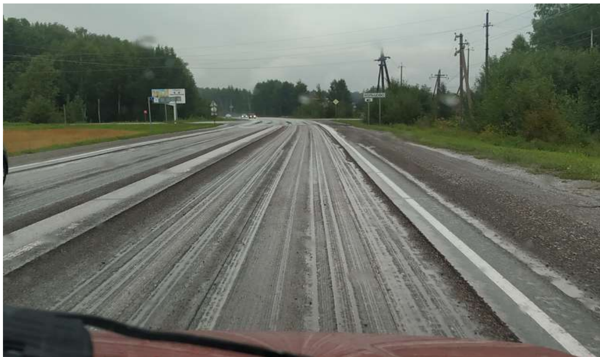
ремонтные работы по г. Кольцово