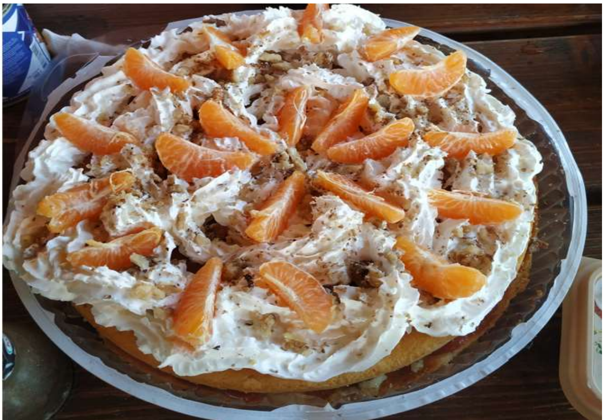
праздничный «походный» торт