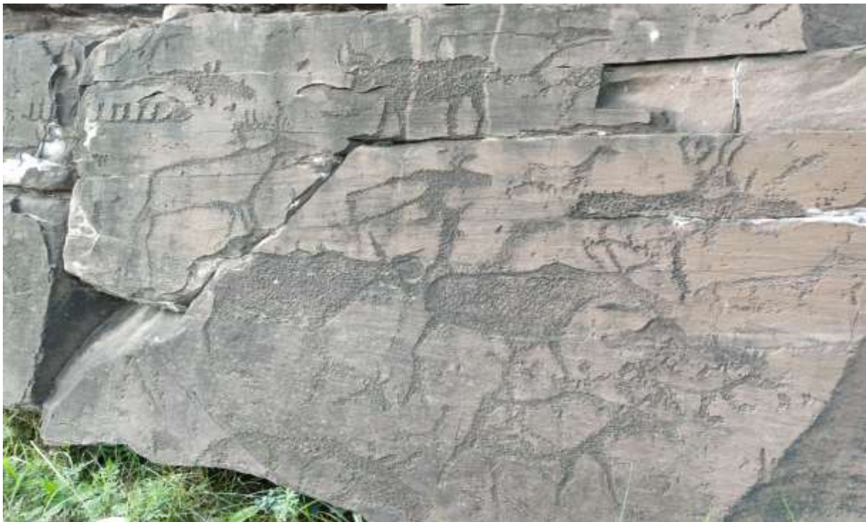
петроглифы на писанице